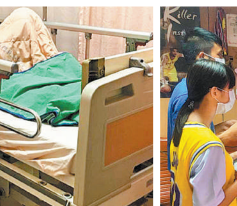
小杰與妹妹在母親遺照前訴說受大家協力情況，盼媽媽在天上安心。