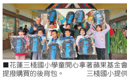
花蓮三棧國小學童開心拿著蘋果基金會提撥購買的後背包。