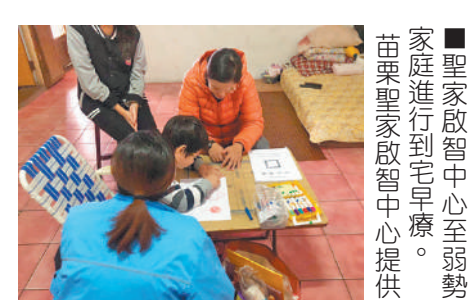
聖家啟智中心至弱勢家庭進行到宅早療。