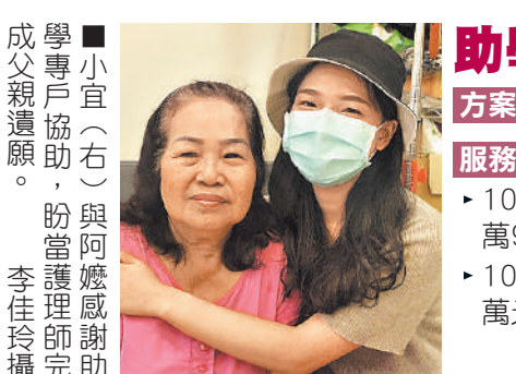
小宜(右)與阿嬤感謝助學專戶協助，盼當護理師完助成父親遺願。