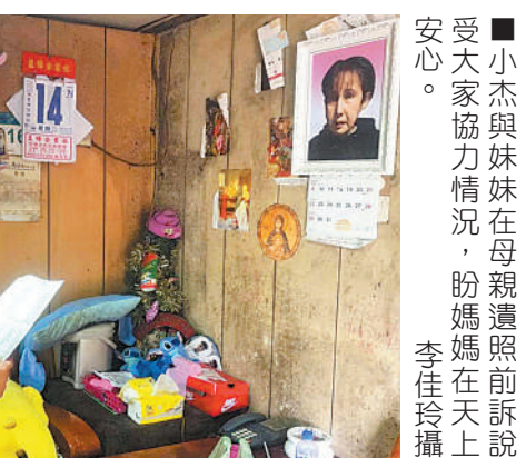
小宜(右)與阿嬤感謝助學專戶協助，盼當護理師完助成父親遺願。