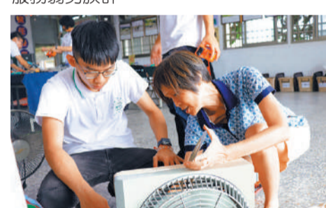
■台科大社服團至偏鄉協助修繕電器。台科大社會服務團提供

蘋果基金會董事吳玉琴說，「社福方案支持全台資源不足單位，讓團體能持續服務，捐款人愛能更圓滿。」蘋果基金會董事蔡松棋說，董事盡力把關，服務弱勢族群。